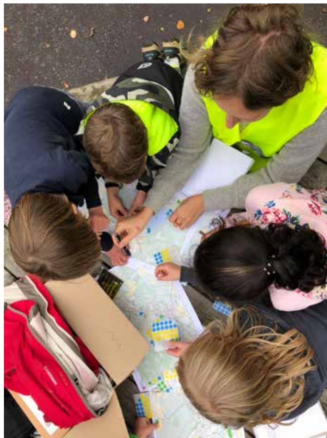
Bild tagen från dialog med barn i Tjörnarp.

Fritidshemmet har fyra olika platser i Tjörnarp som de använder vid utedagar en gång i veckan. Dessa platser är badplatsen, lekplatsen, ödehuset (norra änden av det stråk som går genom östra delen av grönområdet som ligger intill skolan) och en plats intill skolan. Skolan använder de gröna miljöerna i byn i undervisningen.